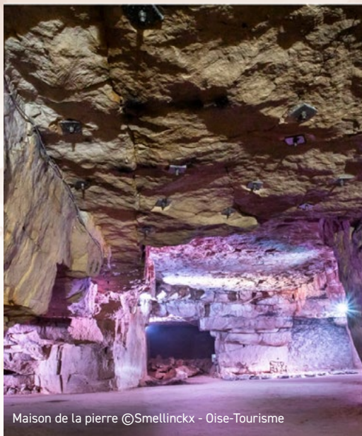
Maison de la pierre

Ici, petits et grands participent, manipulent, créent et repartent avec une expérience unique.